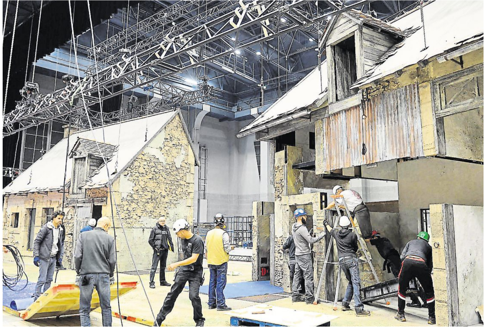
Angers, hier. 36 heures de montage pour le décor des « Bodin's » et une ferme grandeur nature au final.

Les « Bodin's » sont à pied d'œuvre à Amphitea. Ils y construisent une ferme grandeur nature !